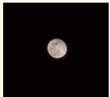
〔ペンネーム〕ぶにぶにさん

このコーナーでは読者の皆様から 投稿いただいた写真を紹介します！ 今回は1枚ご紹介します♪