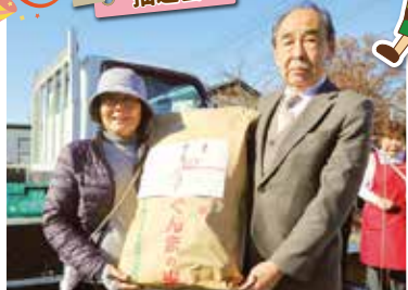
▲組合長賞(お米)を当てた来場者と重田組合長(右)