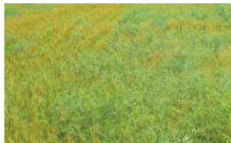
カラスノエンドウ多発ほ場