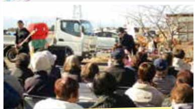
The Break-Down Barriers