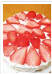
編集担当が作った クリスマスケーキ

8ページで紹介した 女性組織協議会のクリ スマスケーキづくり に広報としてお邪魔しま した。スポンジがオー ブンで膨らんでいく様 子に興味を惹かれ「作っ てみたい」と言ったと ころ、なんとケーキづ くりに参加できること に！！普段から料理を 母親に任せている編集 担当。うまくできるか 不安でしたが、女性部 の皆様が優しく教えて くださったおかげで、 上手にホールケーキが 完成しました。帰宅