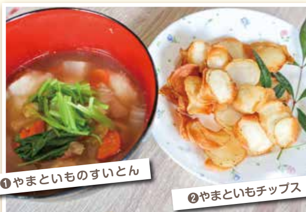
①やまといものすいとん