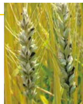
小麦なまぐさ黒穂病

※畑は湛水出来ないため、本病の発生リスクが高い。 特に「ゆめかおり」は注意する。