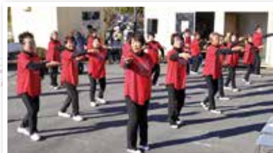
山王町フリーダンスサークル