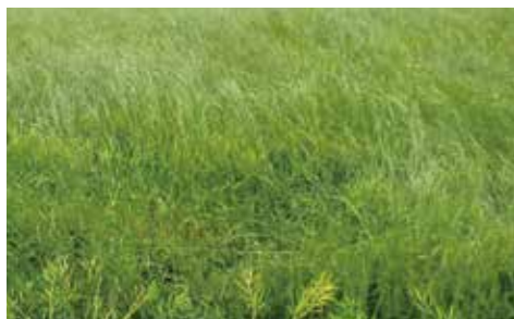
イタリアンライグラス多発ほ場