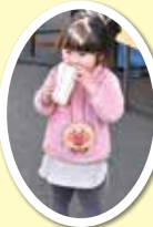
ポップコーン おいしい。