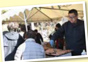
ポップコーンなどの軽食も大人気