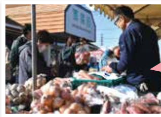
旬の野菜や果物が大特価

天候にも恵まれ、お買い得商品の販売やステージイベントでにぎわいました。 ご来場いただいた皆様、ありがとうございました!