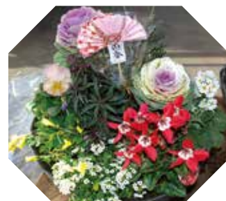
▲できあがった寄せ植え