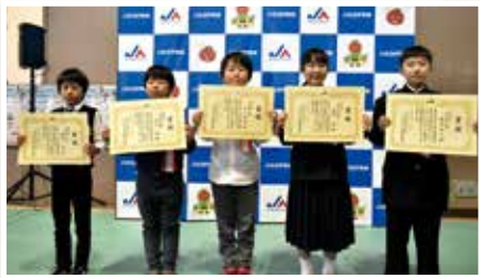
▲書道・交通安全ポスターコンクール入賞者▲