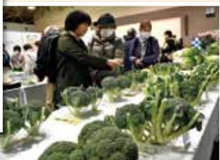
▲管内農産物を展示した見本市