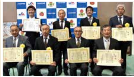
▲農産物共進会表彰者