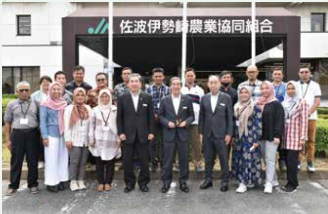
▲当JA役員(中央)と研修生・関係者の皆さん