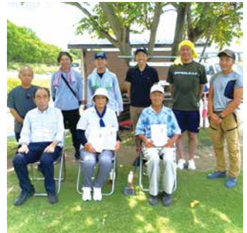
▲優勝者(前列中央)と役員ら