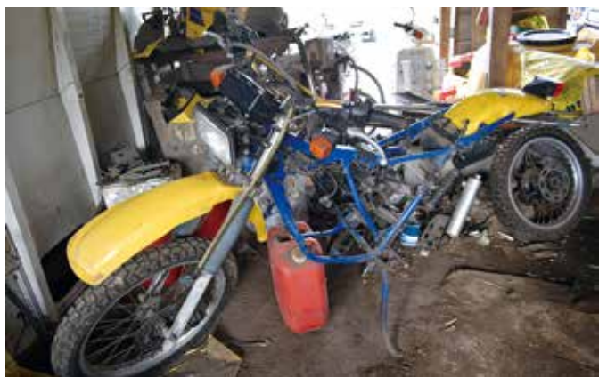
◀修理中の思い出のバイク