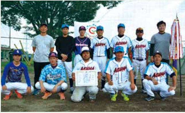
▲優勝したあずま支部の皆さん