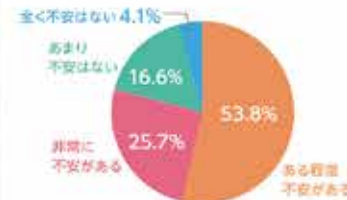
将来の食料輸入についての考え

ウクライナ情勢が長期化するなど世界情勢が不安定ななか、 将来の食料輸入について、どう考えますか。 先進国のなかで最低水準の、およそ6割を輸入に頼っている日本。回答者の約8割が「不安がある」と回答した調査結果もあります。また、「国産」を選ぶ理由として、「安心・安全」「おいしい」のほか、「日本の生産者を応援したい」を選ぶ方も。子どもたちの未来の食卓のために、「国産」を選んでみませんか。