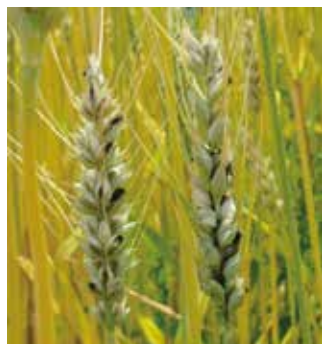
写真 なまぐさ黒穂病